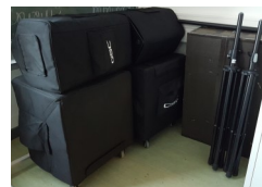
Verbesserung der technischen und räumlichen Ausstattung