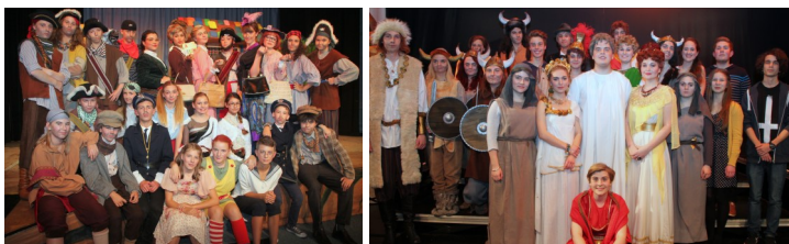
Zahlung des Mitgliedsbeitrages für den Theaterverein zur Unterstützung unserer Theatergruppen