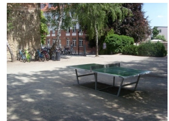
Tischtennisplatten für beide Schulhöfe