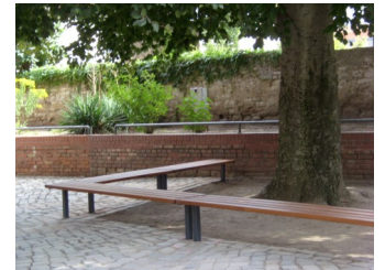
Baumbank für den Schulhof F