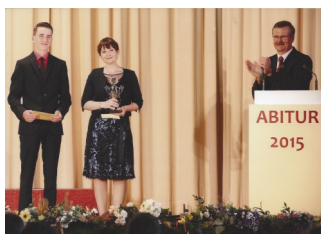
Ehrung der besten Abiturienten mit Pokalen und Büchergutscheinen