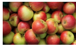
Finanzierung von Apfel- und Plätzchenpause