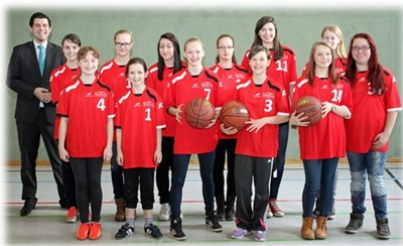
Trikots für unsere Sportmannschaften